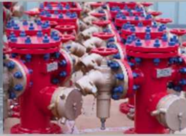
Projets et Services Industriels