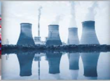
Protection en Milieux Nucléaires