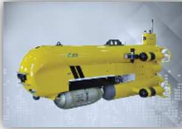
Systèmes Intelligents de Sûreté