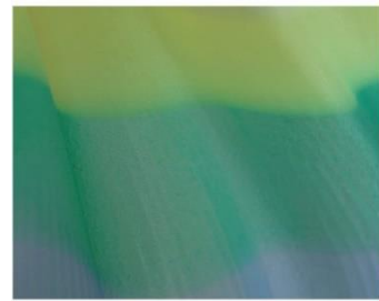
Zoom x 2