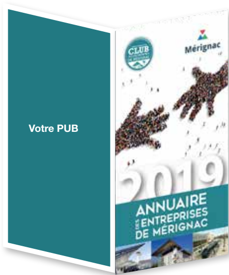
4 ème de couverture Prix adhérent : 1 950 €