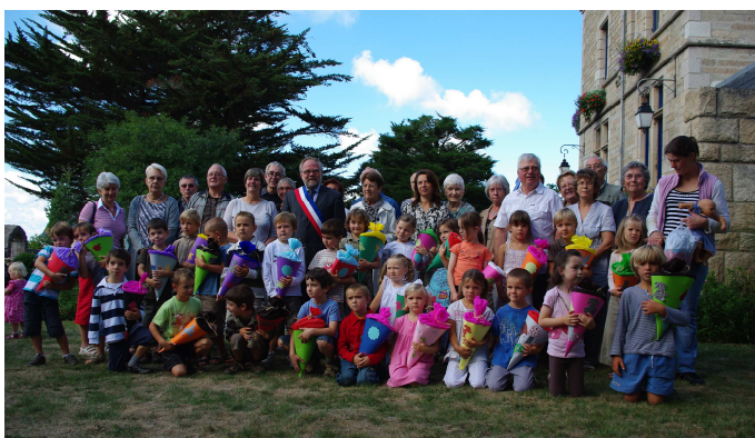
Remise des Schultüte aux enfants entrant au CP