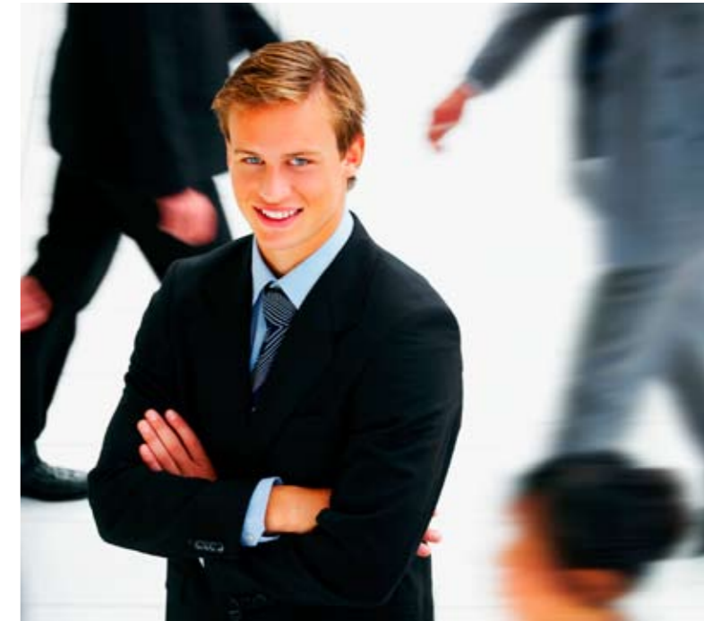
Planning et suivi d'activité