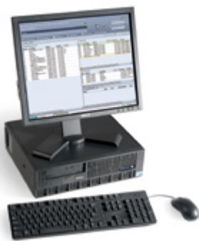
Serveur d'impression Xerox® FreeFlow®

Chaque serveur a été conçu pour répondre à un ensemble précis de critères en matière de flux de production et d'application. Votre représentant Xerox vous aidera à choisir celui qui correspond le mieux à vos besoins.