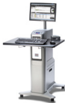
Serveur d'impression Xerox® EX, optimisé par Fiery®