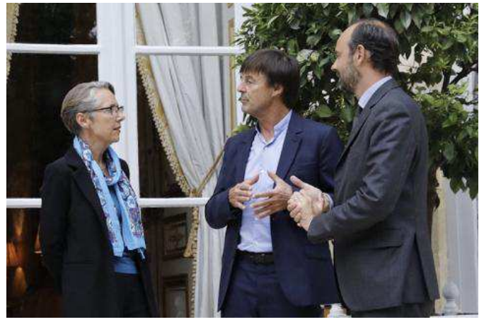
Projet d'aéroport du Grand Ouest : trois médiateurs sont nommés