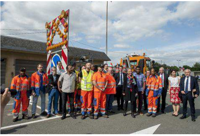
Elisabeth Borne rencontre les agents de la direction des routes d'Île-de-France