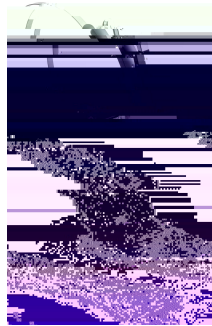
Illustration 8 : Casque Cisco 562