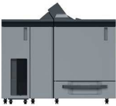
Le thermorelieur PB-503