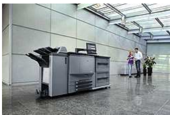
Le business hub PRO C65hc

L'ajout du thermorelieur PB-503 au business hub PRO 1051 permet la production en ligne de tous types de livres dos carré collé, comme l'insertion de pli en Z, de feuilles et de couvertures couleur pré-imprimées, la reliure des livres jusqu'à 30 mm d'épaisseur et le massicotage de couverture en ligne. Le magasin de couverture intégré dispose d'une capacité de 1 000 feuilles. Le PB-503 comprend un module de réception monté sur chariot pour la production de livres. Le PB-503 peut également être associé au module d'agrafage FS-521.