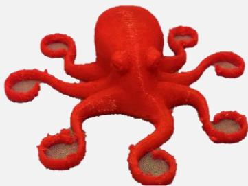
Objet imprimé en 3d