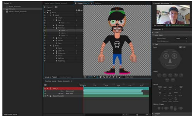
[사진자료2] 더 편리하고 효율적으로 진화한 캐릭터 애니메이터 기능

한편, 현재 어도비 크리에이티브 클라우드는 세계 영화제들을 휩쓴 많은 감독들과 편집자들에게 채택되는 등 업계에서 두드러진 존재감을 나타내고 있다. 특히, 가장 최근에는 전세계 박스오피스를 강타한 할리우드 블록버스터 <데드풀(Deadpool)>이 프리미어 프로 CC, 애프터 이펙트 CC와 같은 어도비의 비디오 툴로 탄생했다. 영화계의 거물인 데이비드 핀처(David Fincher) 감독이 넷플릭스와 함께 선보일 신작 미드 <마인드헌터(Mindhunter)>와 더불어 현재 압도적인 해상도의 레드 드래곤(RED Dragon) 6K 카메라로 촬영 중인 영화 <6 빌로우(6 Below)>도 프리미어 프로 CC로 제작될 예정이다. 뿐만 아니라, 크리에이티브 클라우드의 비디오 툴은 유튜브와 페이스북, 인스타그램과 같은 소셜 미디어 채널에서도 널리 활용되고 있다.