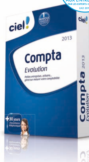
Personnalisez votre environnement de travail grâce à INTUICIEL®.

Petites entreprises, artisans, commerçants gérez sur mesure votre comptabilité générale et analytique, vos prévisions budgétaires, votre trésorerie et vos immobilisations.