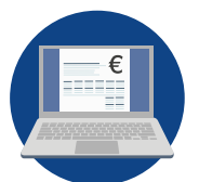
Votre logiciel EBP Comptabilité