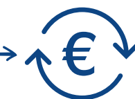
EBP Synchro Banque