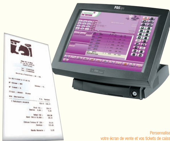
Personnalisez votre écran de vente et vos tickets de caisse

Encaissez les règlements de vos clients aussi rapidement qu'avec une caisse enregistreuse. Offrez la possibilité à vos clients de régler le montant avec plusieurs moyens de paiement (carte bleue, chèque, espèces, ticket restaurant...).