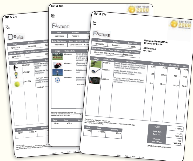
Présentez à vos clients des documents professionnels

Un client tarde à payer ? Relancez-le sans plus attendre ! Sélectionnez le niveau de relance adapté. Puis, d'un simple clic, envoyez-lui la lettre par e-mail au format PDF.