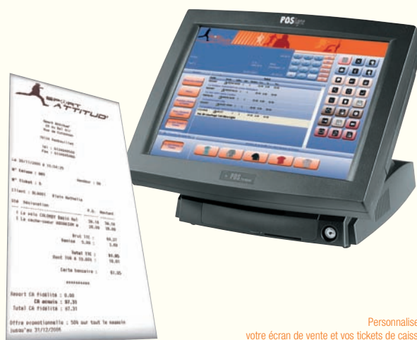
Personnalisez votre écran de vente et vos tickets de caisse

Encaissez les règlements de vos clients aussi rapidement qu'avec une caisse enregistreuse. Offrez la possibilité à vos clients de régler le montant avec plusieurs moyens de paiement (carte bleue, chèque, espèces, ticket restaurant...).