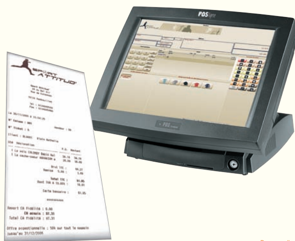
Personnalisez votre écran de vente et vos tickets de caisse

Encaissez les règlements de vos clients aussi rapidement qu'avec une caisse enregistreuse. Offrez la possibilité à vos clients de régler le montant avec plusieurs moyens de paiement (carte bleue, chèque, espèces, ticket restaurant...).