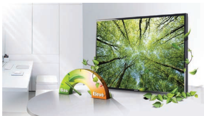
Figure 1. Le rétroéclairage des séries ME et ED de Samsung améliore la qualité d'image.