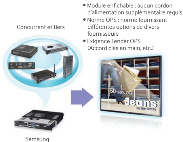
Figure 4. Le module enfichable offert en option remplace de multiples appareils avec fils.

Éliminez le besoin d'un PC externe. Les écrans DEL grand format de la série ME incluent le logiciel d'affichage numérique MagicInfo™ Lite de Samsung, une solution d'affichage tout-en-un dotée d'une mémoire et d'un lecteur multimédia internes. En utilisant le logiciel MagicInfo™ de Samsung, les administrateurs peuvent gérer, organiser et programmer le contenu affiché sur de multiples écrans par l'intermédiaire d'une interface Web.