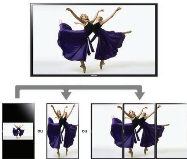
Figure 6. La rotation d'image de la verticale à l'horizontale améliore la convivialité, sans perte de format.

La rotation d'image met le message en valeur avec deux options de format : le format original et le format pleine grandeur automatique.