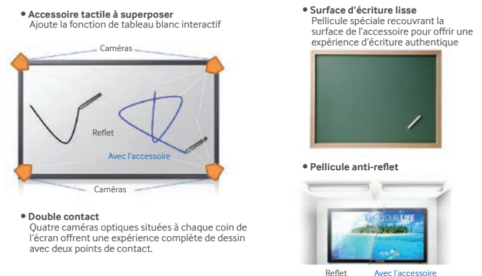
Figure 5. Les écrans de 65 po de la série ME proposent un accessoire tactile à superposer utilisant quatre caméras pour fournir des capacités d'écriture et de dessin.

L'installation de l'écran tactile est facile. Il suffit de placer l'accessoire sur l'écran, de pousser les supports vers le bas, puis de serrer quelques vis.