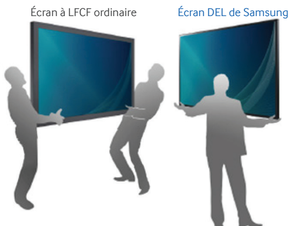
Figure 3. Les écrans DEL grand format sont plus faciles à manipuler que les écrans grand format à LFCF.

La largeur des cadres des écrans grand format des séries ME et ED est plus étroite que celle des écrans grand format traditionnels. Par exemple, les écrans de la série ME sont dotés d'un cadre d'une largeur de seulement 12,5 mm (0,49 po) sur les côtés et de 15 mm (0,6 po) dans le bas. Les cadres étroits détournent moins l'attention du public et ajoutent une touche de raffinement à l'ensemble du message.