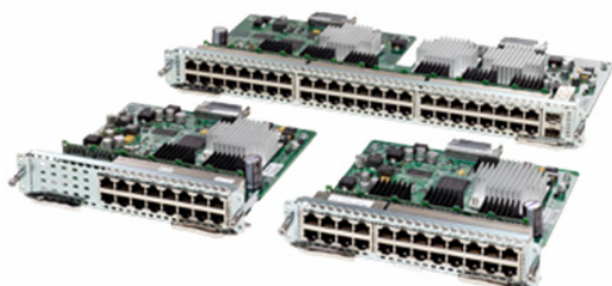
Figure 1. Modules de services Cisco Enhanced EtherSwitch

Les modules de services Cisco Enhanced EtherSwitch (figure 1) étendent considérablement les fonctionnalités du routeur en intégrant une des meilleures commutations couche 2 et couche 3 offrant le même ensemble de fonctionnalités que les commutateurs des gammes Cisco Catalyst ® 3560-E et Catalyst 2960. Les nouveaux modules de services Cisco Enhanced EtherSwitch sont les premiers à tirer parti des capacités accrues des routeurs à services intégrés des gammes Cisco 3900 et 2900. En outre, ces modules de services permettent les initiatives d'excellence de Cisco en matière d'alimentation, à savoir Cisco EnergyWise ® , Cisco Enhanced Power over Ethernet (ePoE) et la surveillance de l'alimentation PoE par port, qui facilitent l'adaptation de la filiale aux exigences de nouvelle génération, tout en respectant les initiatives importantes pour que les équipes informatiques veillent à l'efficacité énergétique de leur réseau. De plus, les modules de services Cisco Enhanced EtherSwitch n'effectuent pas seulement la commutation et le routage à fréquence de ligne locaux, ils prennent également en charge la communication directe entre modules de services grâce à la structure multigigabit (MGF) des routeurs à services intégrés de 2 ème génération qui sépare le trafic LAN des ressources WAN.